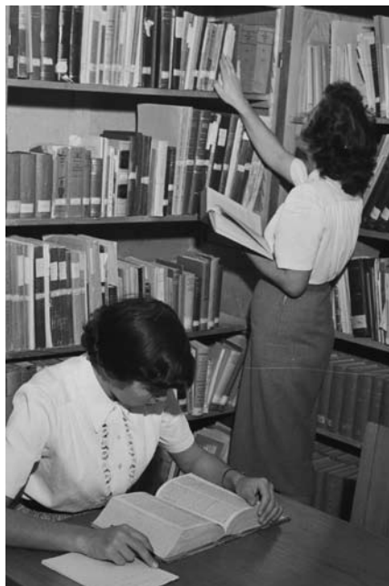
ספריית ראש הממשלה, הדר קריאה ודיונים.