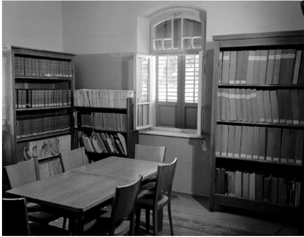
ספריית ראש הממשלה.

המבנה עמד בקריטריונים המחמירים לשימור, הכוללים גם מרכיבי בנייה וריהוט מקוריים ושמירה קפדנית על חלוקת החלל הפנימית המקורית מימי המושבה הטמפלרית. סך כול השטח שיועד לתצוגה ותפקודים נלווים הוגדר בכ-195 מ"ר בחלוקה פנימית של בית מגורים. שטח זה נפרש על פני שתי קומות ומרתף. המשמעות הייתה ברורה: הבית שנועד למגורים אינו יכול להכיל בחדריו הקטנים קהל רב או קבוצה המתכנסת סביב מדריך. ואולם, ערכי שימור, שעשויים להיתפס על-ידי אחדים כמגבילים, דווקא טומנים בחובם פוטנציאל רב בכל השימושים. המגבלה שבהובלת קבוצות מאורגנות הכתיבה למעשה מסלול שממנו נגזרה התפיסה הרעיונית של התצוגה: הליכה בבית באופן חופשי בדומה לביקור בבית מגורים פרטי, בשיטוט בין החדרים המייצגים תקופות שונות שבהן שינה הבית את אופיו והחליף את דייריו. המרכז הוגדר על-ידינו כמוקד תצוגה במסלול הנפרש על פני מתחם שרונה כולו על בתיו וגניו. אלה נתפסים כמוצגים ואזורי תצוגה, ומרחיבים את שטחי הביקור וההתכנסות אל מעבר לגבולותיו הצרים של הבניין. הבית עומד במרכזה של תצוגת חוצות – מוזיאון פתוח, הכולל את בתי המושבה ואתריה, כשהסיוור ביניהם יהיה בשטחי חוץ ופנים נגישים לציבור. המבקרים במרכז עוברים בין חדרי בית מגורים, ואולם החדרים משתנים במסלולם וכל חדר מייצג תקופה, מאורעות ובעיקר מזמן מפגש ממרחק הזמן עם דיירי הבתים.