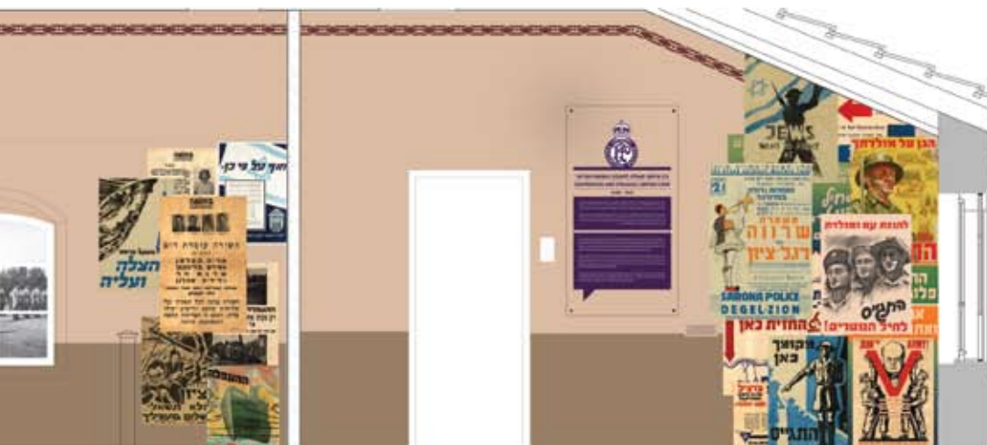
הדמיה של עיצוב חדר במרכז המבקרים. עיצוב סטודיו רוט-טבת, מדיה: בריוו קריאטיב

גם במעבר מהיר בין חדרי הבית, ללא התמהמהות או קריאה מעמיקה, התחושה היא של מסע בזמן: החל בחדר טמפלרי המרוהט בריהוט כפרי ומעניק דימויים נעימים ורכים של חדרי בית פסטורלי, דרך התפתחות התרבות המודרנית המוצגת על-ידי הסגנון הבינלאומי ועד לייצוגים הנוקשים של ימי מלחמת העולם השנייה, הנאציזם, תקופת המאבק ומלחמת העצמאות. הפיכת הבתים הפרטיים לשטח צבאי ולשדה מלחמה ולאחר מכן שימוש בחדרים כמשרדים אפרוריים. לדוגמה: התקופה הפוסט-טמפלרית מציגה את החלל כאזור צבאי. השפה העיצובית משתנה מחדרי בית מגורים לשימושים צבאיים ואזרחיים ציבוריים: מדים, ניירת, אביזרים וסמלים המייצגים את השלטון הבריטי ובהמשך את הממשל הישראלי. העיצוב אינו יוצר תפאורה או שחזור מדויקים אלא עושה שימוש בפרטי ריהוט ודימויים המרכיבים טקסט חזותי המייצג באופן חד וברור את צירי המתח הניצבים בבסיס הסיפור. בכל חדר נפתח חלון אל המציאות שנשקפה מבתי שרונה אל סביבתם הקרובה, יפו ותל-אביב. קומת המרתף מוקדשת לנושא המאבק לשימור שרונה ומפעל השימור והשיחזור רחבי ההיקף. בסופו של המסלול מייצג ייחודי, שנעשה בהשראת תצלומים היסטוריים, המסכם בהרף עין את גלגולי המתחם. בשרונה נחשפו עיטורי קיר רבים וצביעת קירות החדרים נעשתה בעצה אחת עם שי פרקש, משמר ציורי הקיר. 6