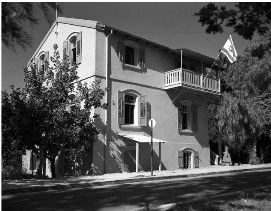
בית בלדנהופר, רחוב אלברט מנדלר 14, בשנות החמישים למאה הקודמת.