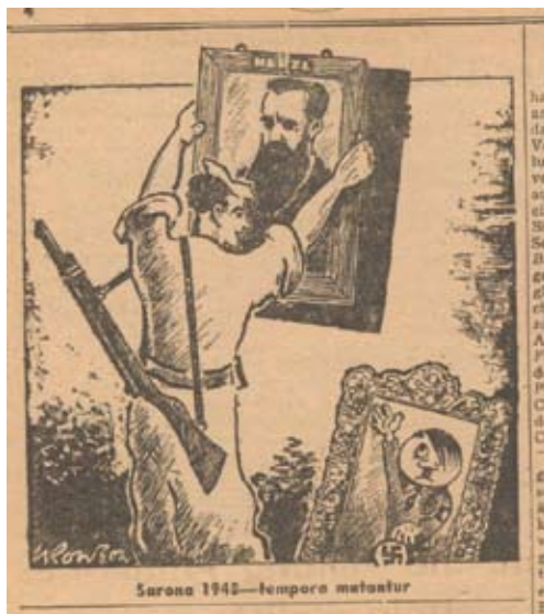
שרונה 1948 - זמנים משתנים" קריקטורה בכתב העת 3 Aufbau

מסלול התצוגה עובר בין פרקים של בנייה חלוצית ופיתוח חקלאי בשולי העיר לפרקים של שעות דמדומים וימי מלחמה. הבתים נבנים, משנים צורה וייעוד, מאוכלסים ומתרוקנים מיושביהם חליפות, במעברים חדים, כמעט בלתי יאמנו, המייצגים את המתחים העומדים בציר מהלכה של ההיסטוריה המקומית בעת החדשה על רקע מציאות עולמית משתנה.