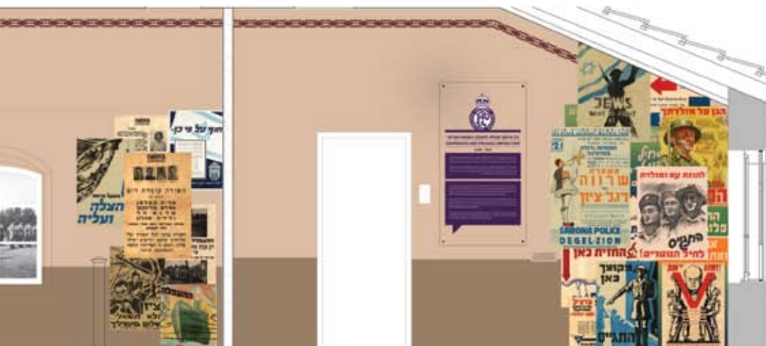
הדמיה של עיצוב חדר במרכז המבקרים. עיצוב סטודיו רוט-טבת, מדיה: בריו קריאטיב