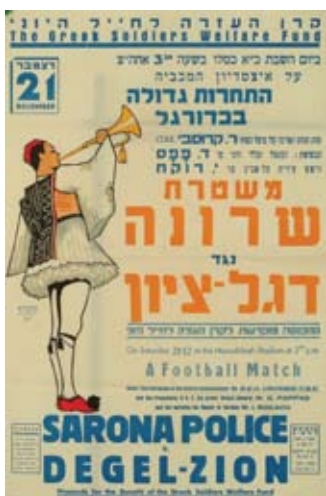
כרוז בדבר משחק כדורגל בין שחקני משטרת שרונה לקבוצת דגל ציון, ראשית שנות הארבעים

לאחר שרוב הטמפלרים פונו מהמחנה, תוגברו בו כוחות הצבא והמשטרה הבריטיים. בתום המלחמה הפך המחנה המבוצר לבסיס