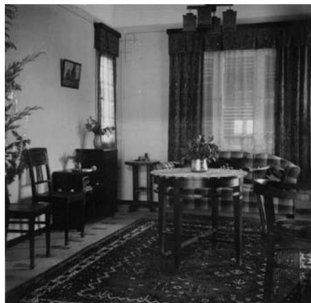
בית משפחת ונוס. סגנון ריהוט טיפוסי של בית טמפלרי של בני הדור השני והשלישי

בשלהי שנת 1917, לאחר כיבוש דרום הארץ בידי הצבא הבריטי, הטמפלרים תושבי שרונה הוכרזו 'נתיני אויב' והוגלו למצרים. המושבה הייתה למחנה צבאי בריטי ורק בשנת 1921 הורשו הטמפלרים לשוב לבתיהם בשרונה.