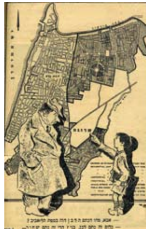
אבא, מהו הכתם הלבן הזה במפת תל-אביב? כלום זה כתם לבן, בני? הרי זה כתם שחור..." ציור: יוסף בם. קריקטורה שהתפרסמה בדיעות תל-אביב, דצמבר 1943

מפעל ההתיישבות הטמפלרי בארץ בא לקצו באפריל 1948, עם עזיבת אחרוני הטמפלרים את הארץ בחסות שלטונות המנדט.